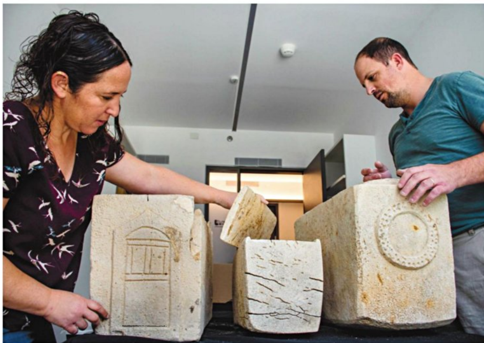
בדיקת הגלוסקמאות, אתמול. תיבות האבן שימשו יהודים לליקוט עצמות

המערה, שלפי רשות העתיקות צפויה לתרום למחקר