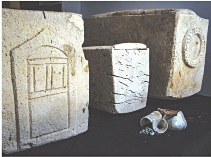
OSSUARIES FOUND in a burial cave near Nazareth.

Inspectors of the authority's anti-theft unit noticed a number of piles of earth in the area of the lot, which seemed to be hiding something behind them. The owner of the land and responsible for the construction site was asked to remove the piles of dirt, and behind them, an ancient burial cave was discovered, hewn out