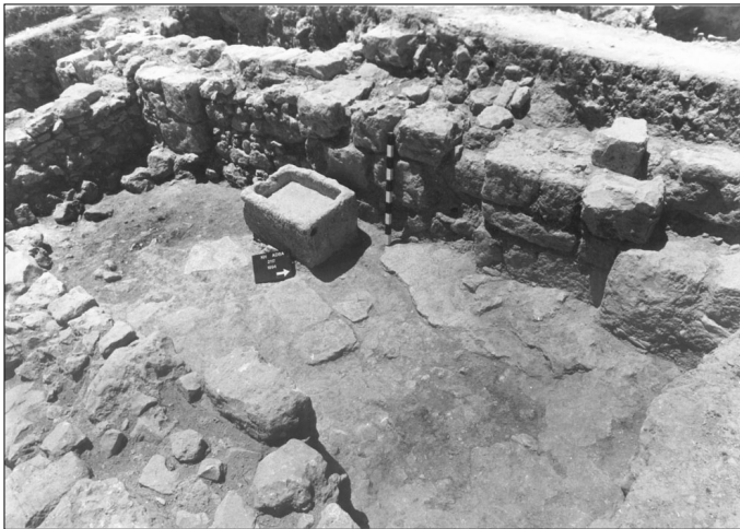
האתר בזמן החפירה