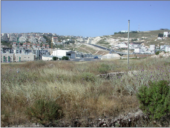
מבט מהאתר לכיוון מערב.