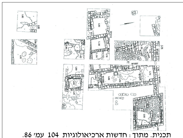
תכנית. מתוך: חדשות ארכיאולוגיות 104 עמ' 86.