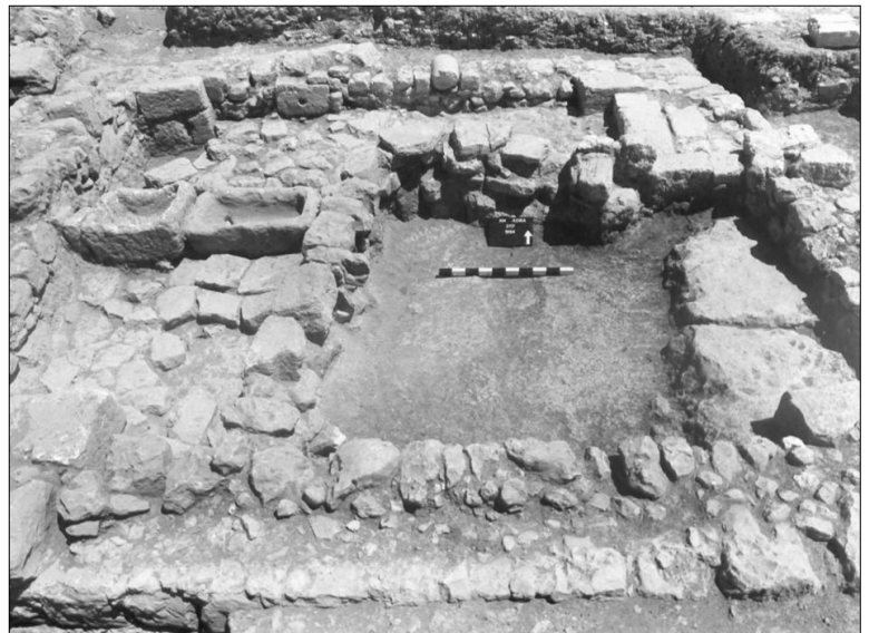
האתר בזמן החפירה