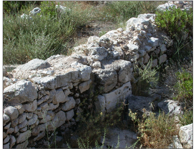
אומנה (גזית) הצמודה לקיר (גויל).