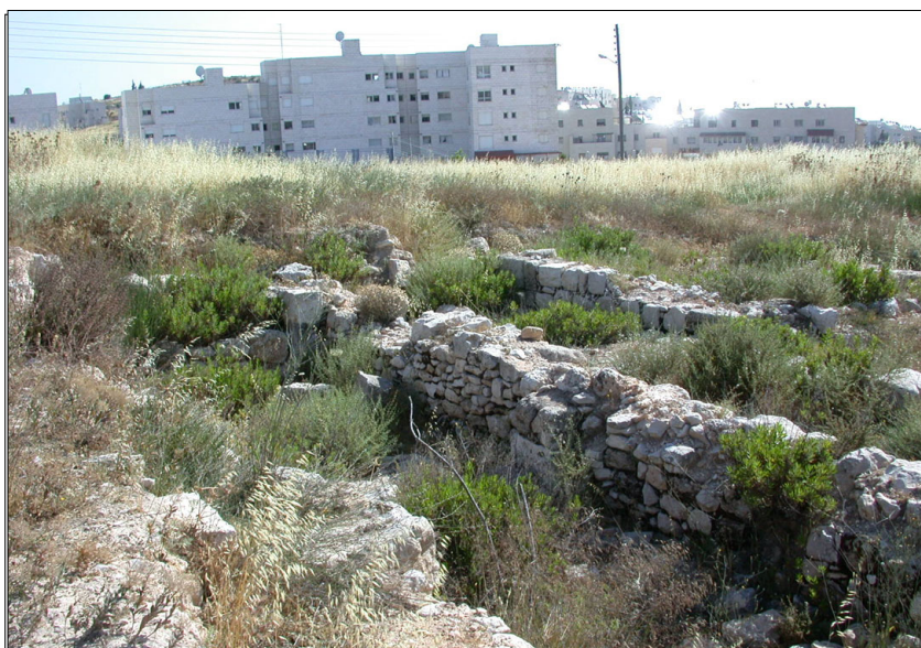
חר' עדאסה (דרום)

דרומית מערבית למכלול זה תועדו מתקנים ושרידי מבנים: בורות מים, שרידי מבנה מלבני (5.62*10.33) ששימש תחילה כמאגר מים ולימים הוסב למגורים. גת שעיקרה משטח דריכה, שבמרכזו נחצב בור. בקרבת הגת: שני בורות מים עגולים (ע"פ סקר ירושלים).