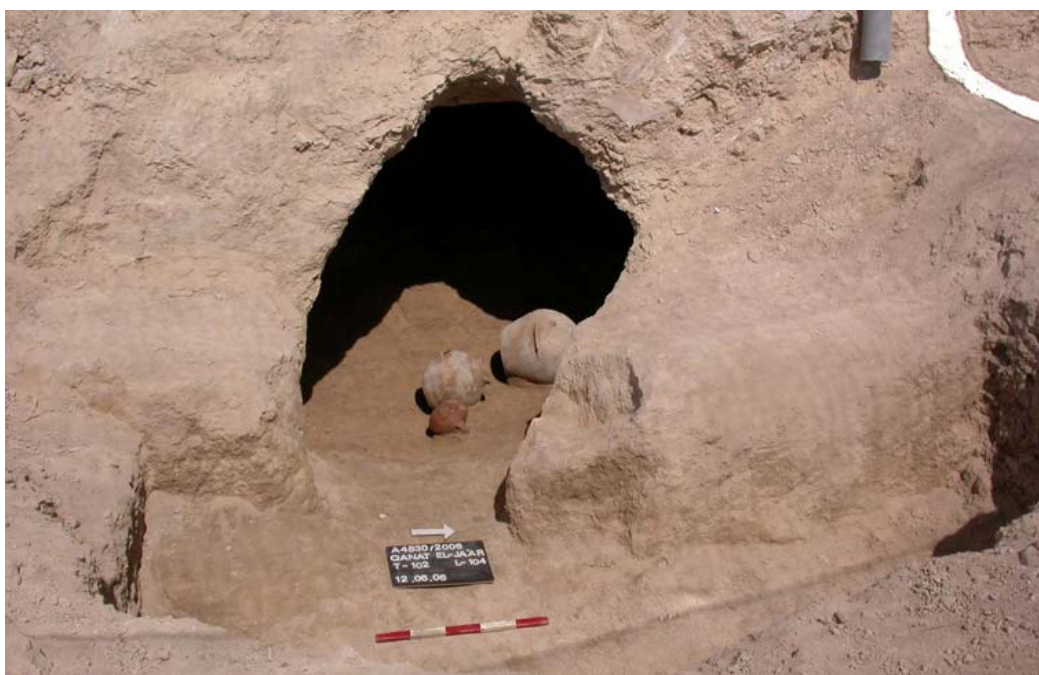
קבר מספר 102 שרידי פיר הכניסה ומבט לכיוון המסדרון, צולם מכיוון מזרח למערב.

בתנוחה מכווצת (ברכיים כפופות לכיוון החזה) על צדם הימני או השמאלי. ראש כל הפרטים הופנה לכיוון מזרח ופניהם הופנו לכיוון צפונה או דרום.