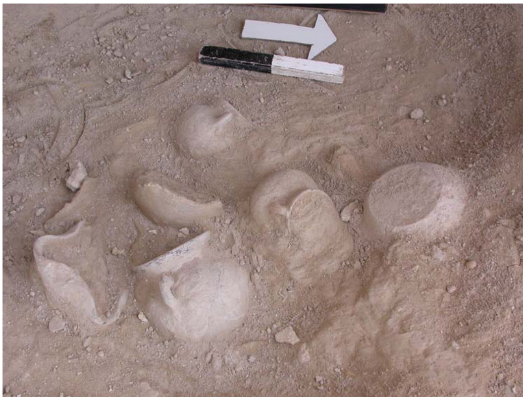
קבר 100 לוקוס 101 חלק מהממצאים באתרם על רצפת הקבר: