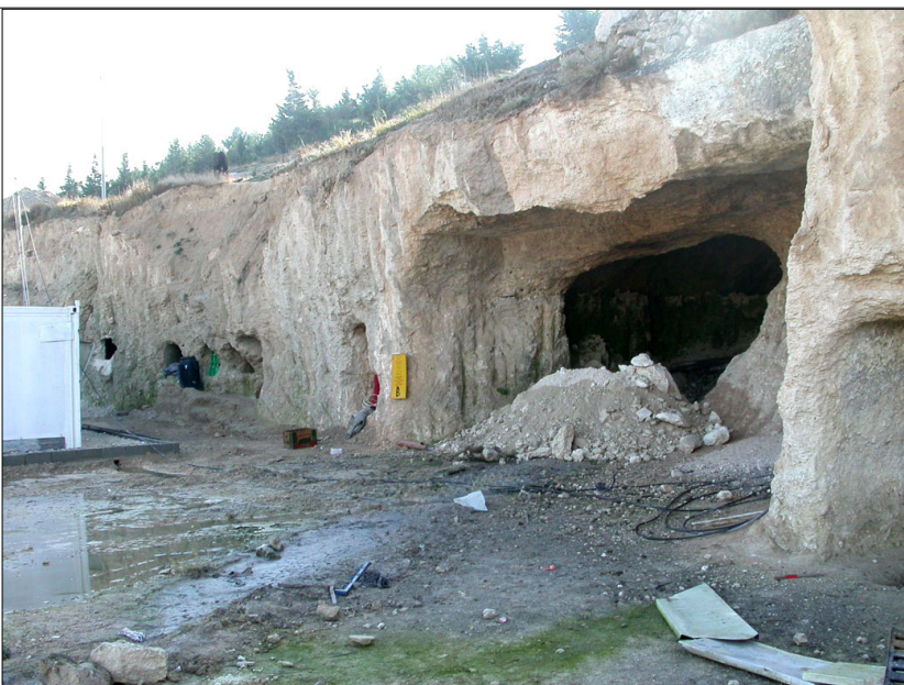
מערות קבורה, נחל אצל

מערות קבורה רבות, המתוארכות ברובן לתקופה ההורדוסית. המערות בנויות במתכונת של חדרים חצובים בסלע ובדפנותיהם כוכים ו/או מקמרים. בחלק מהמערות נחצב במרכז החדר בור עמידה. בחלק מהמערות נמצאו גלוסקמות המעוטרות בדגמים שונים ובכתובות כדוגמת: 'יהוסף בן קפאי', 'שלום', 'שם' ועוד. לחלק מהמערות עוצבה חזית מונומנטלית, סותת פתח קשות (בצורת קשת) והותקנה חצר. באחד הקברים נתגלתה גלוסקמה, בה נזכרת משפחתו של כיפא, הכהן הגדול.