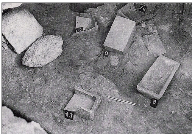
'קבר משפחת קיפא', מתוך: קדמוניות 99-100