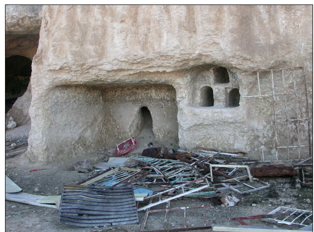
חזית מערת קבורה