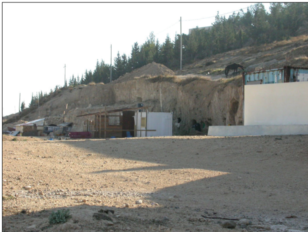
הקשר סביבתי: בנייה בלתי חוקית