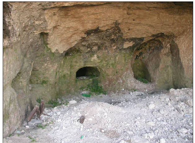
פנים מערה, כוכים