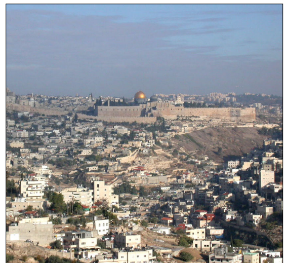
מבט מהאתר לכיוון צפון